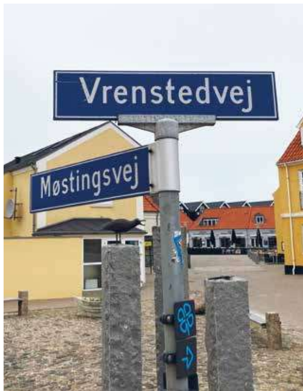
Et par af kommunens nye gadeskilte på Vrenstedvej og Møstingsvej i Løkken.