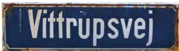
Det gamle emaljerede gadeskilt på hjørnet af Søndergade og Vittrupsvej i Løkken.