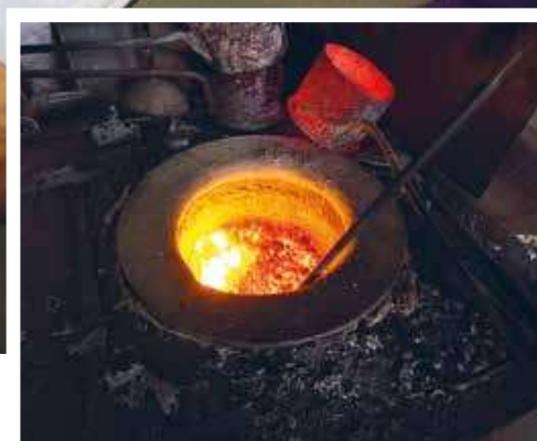
Diglen med det rødglødende smeltede aluminium som der støbes skilte af.