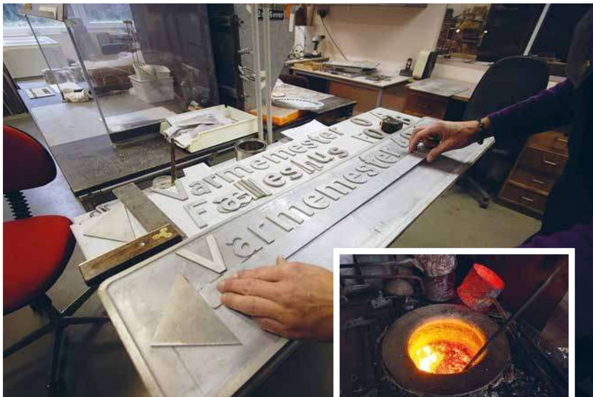
Sætteriet hvor de mange forme til de støbte aluminiumsskilte bliver skabt.