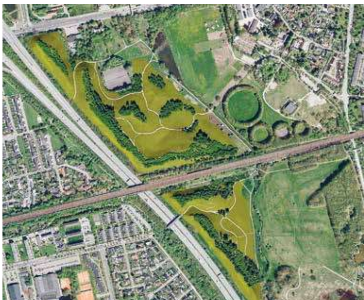
Figur 1: Hyldager Bakker (Hasløv & Kjærsgaard)

Beregningerne, som FORCE Technology foretog, viste, at Hyldagergrunden var udsat for en støjbelastning på op mod 62 dB. FORCE Technology foreslog