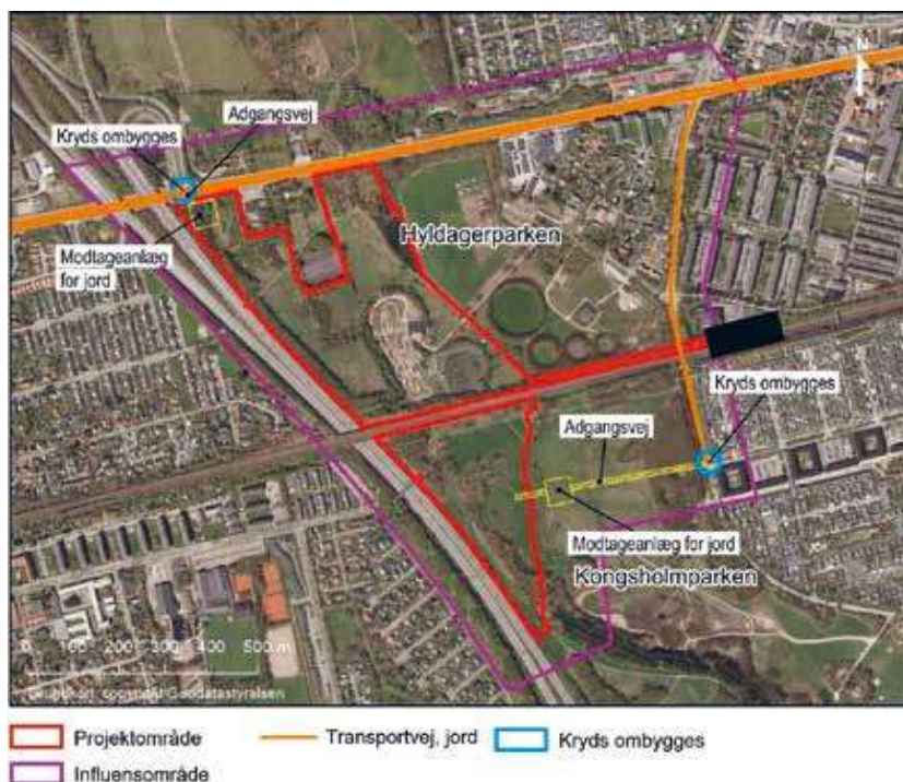
Figur 4: Hyldager Bakker, projektområde (COWI)