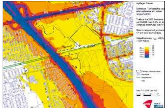
Figur 3: Støj kort, efter Hyldager Bakker (FORCE Technology)

at etablere to støjvolde, der kunne reducere støjen til 58 dB. Den ene støjvold skulle være 520 meter lang og ligge langs Holbækmotorvejen nord for jernbanen, og den anden skulle ligge langs Holbækmotorvejen syd for jernbanen med en længde på 450 meter. Derudover skulle der etableres en to meter høj støjskærm langs jernbanen København-Roskilde, placeret i niveau med skinnerne og med en længde på cirka 700 meter. For at komme helt i mål med støjdæmpningen, så skulle de støjende aktiviteter fra Albertslund Motorsportscenter også ophøre.