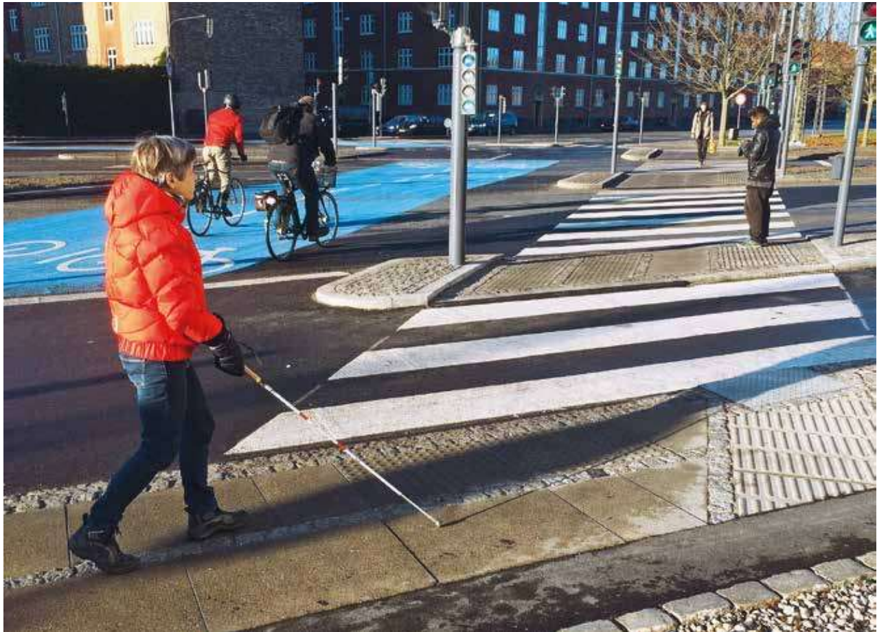
Figur 5: Fodgængerfelt ved Scandiagade / Sydhavnsgade København SV. Der er opmærksomheds- og retningsfelter på fortove og heller samt lydfyr. En ledelinje i især skæve kryds vil yderligere støtte blinde personer i at holde retningen.

for at stille fx cykler og løbehjul uden for ledelinjer og gangbaner. Omvendt er information til personer med synshandicap om udformningen af nye eller ombyggede anlæg tilsvarende vigtig.