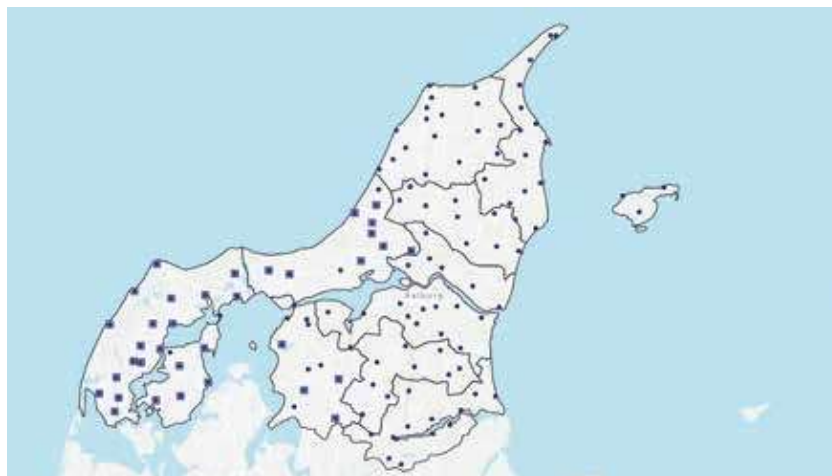
Figur 5: Kortet illustrerer med firkanter de opsatte knudepunktsmarkører samt placeringerne for de næste knudepunktsmarkører med cirkler.

Først og fremmest er det næste skridt dog at få udbredt kendskabet til knudepunktsmarkørerne, så kunderne forstår, hvad skiltet betyder, og hvordan de kan bruge det i både deres daglige pendling og i deres fritidsrejser. NT samarbejder med de nordjyske kommuner omkring at få kommunikeret og informeret kunderne omkring knudepunktsmarkørerne, når de er opsat. ●