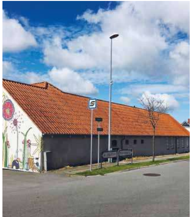
Figur 3: Knudepunktmarkøren i Nørhalne.

Mødestederne er fastlagt ud fra en konkret vurdering af, hvor det giver mening at placere mødesteder i forhold til store transportflows, oplagte opsamlingspunkter i landsbyerne, men selvfølgelig også ud fra en betragtning om hvor det er sikkert at samle op/blive samlet op. Samtidig er der også lagt op til, at brugere kan komme med input til ønskede placeringer. Fx bli-