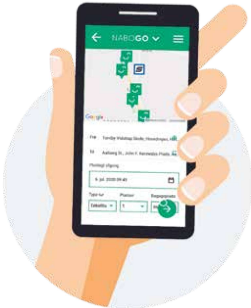
Figur 2: NaboGOs platform viser både mødesteder og knudepunkter i Nordjylland. Her et eksempel fra Tornby mellem Hirtshals og Hjørring.

som et geografisk fixpunkt og er med til at tage kunden i hånden og sikre en tryk rejse og skift mellem mobilitetsformer, da man i fremtiden vil kunne se de virtuelle knudepunkter fx i en samkørselsapp, og man vil kunne navigere efter den fysiske knudepunktmarkør i virkeligheden. Opkoblingen mellem det virtuelle mødested og det fysiske mødested vil dermed skabe bedre forbindelser mellem forskellige former for mobilitet og samtidig gøre rejsen mere brugervenlig.