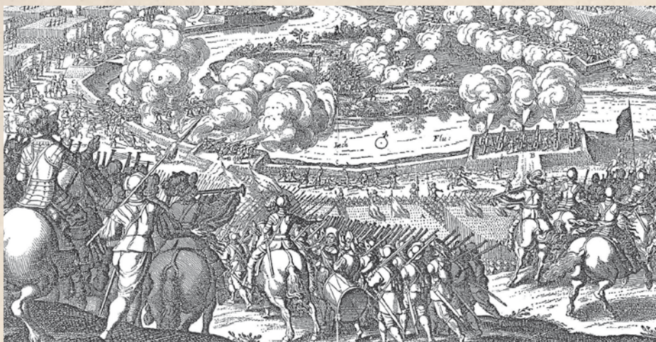
Figur 3. Svenskerne overgik floden Lech i 1632. Samtidigt kobberstik.

Hermed har vi fået placeret et par kendte begreber relateret til hærvejen eller de hære, der fulgte den gamle vej. ■