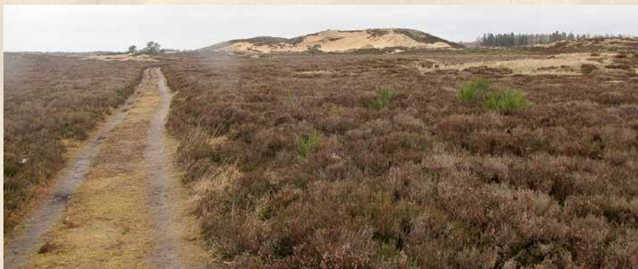
Figur 1. Randbøl Hede med Staldbakkerne set fra øst. I baggrunden det 17 m høje Stoltenbjerg, den største indlandsklit, som vinden har blæst sammen på den flade hede.

Leksikalt: En landsknægt (fra ty. Landsknecht , jf. landsknægt) betegner en lejesoldat, der tjener i fodfolket i en hær. Ordet landsknægt bliver især brugt om tyske lejesoldater i det 15. og 16. århundrede. De var lejetropper, der ved ansættelsen havde sin egen lanse, og med den blev de kontraktansat til et krigstogt, hvor en del af betalingen ofte var retten til at plyndre, hvor de kom frem.