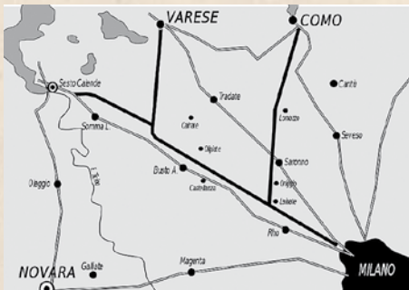
Figur 1. Kort over "Autostrade dei Laghi".