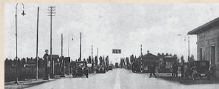
Figur 5. Autostrade dei Laghi ved Musocco med benzinstandere, hvor bilisterne i de første år efter åbningen skulle betale deres kørselsafgift.

Milano med byerne Varese og Como og søerne Lago Maggiore og Lago di Como. De fik derfor navnet "Autostrade dei Laghi" – søernes autostradaer.