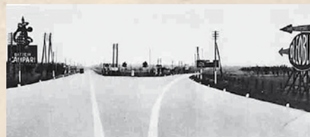
Figur 3. Autostrade dei Laghi deles ved Lainate i to mod henholdsvis Como og Varese.