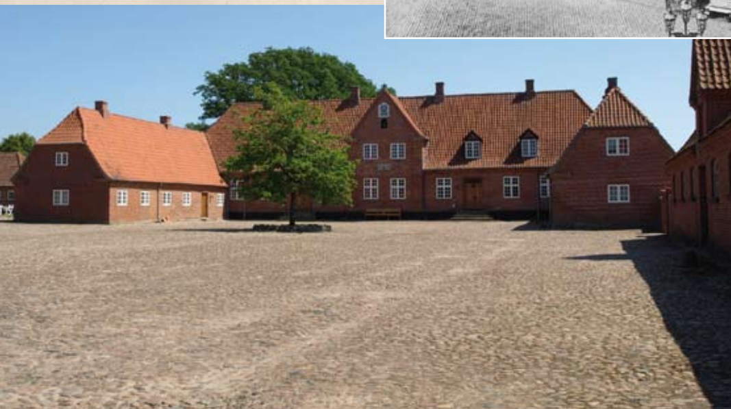
← Figur 1. Williamsborg i Daugård, som det ser ud i dag.