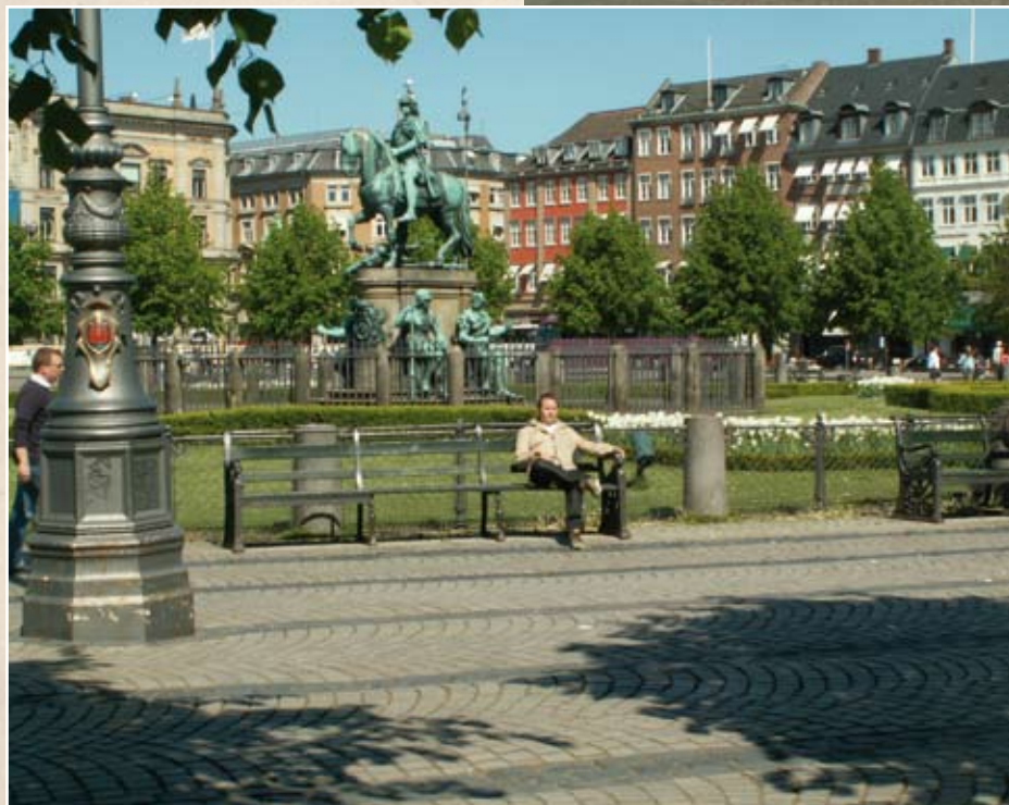
↑ Figur 3. Kongens Nytorv set fra taget af Det Kongelige Danske Kunstakademi.